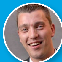
Paul Coolen Administratie